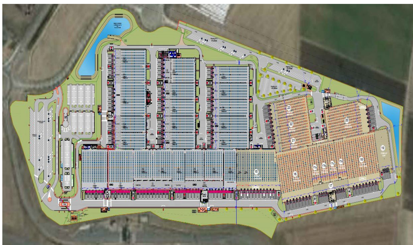
Plan de la plateforme actuelle et de son extension à l'est

Le projet d'extension prévoit la construction de douze nouvelles cellules venant se positionner dans le prolongement des installations existantes, à l'est du site. Après extension, la plateforme occupera une surface d'environ 34 ha dont environ 143 000 m 2 de surfaces construites.